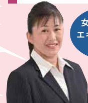
女性防災士の エキスパートが 登場！

府立男女共同参画・青少年センター/ ドーンセンター 5階 大会議室2(中央区大手前1-3-49)/ 10:30～12:30/参加無料/ 定員50名(申込優先)/☎06-6210-9321